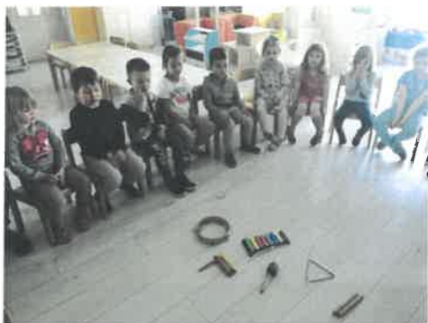
Slika 38. Projekt „Glazba u vrtiću, Cicibani