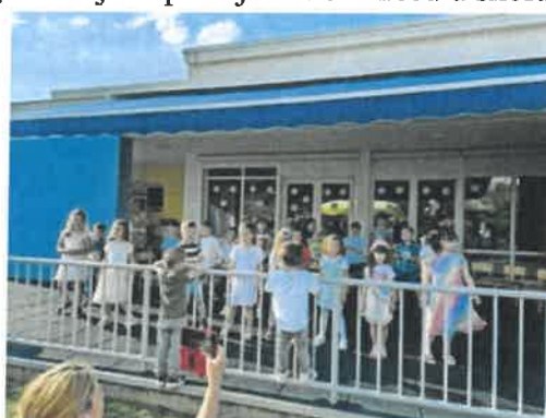
Slika 77. završna druženja, Tratinčice