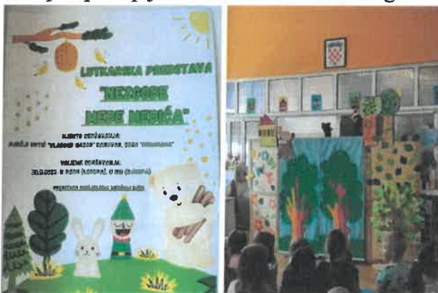
Slika 58. i 59. Predstava „Nezgode Mede Medića“

Naš vrtić tradicionalno sudjeluje u akciji čišćenja i prikupljanja smeća. Kao i do sada sav otpad prikupljamo i razvrstavamo. Ove godine sakupili smo puno papira, stakla, plastike.