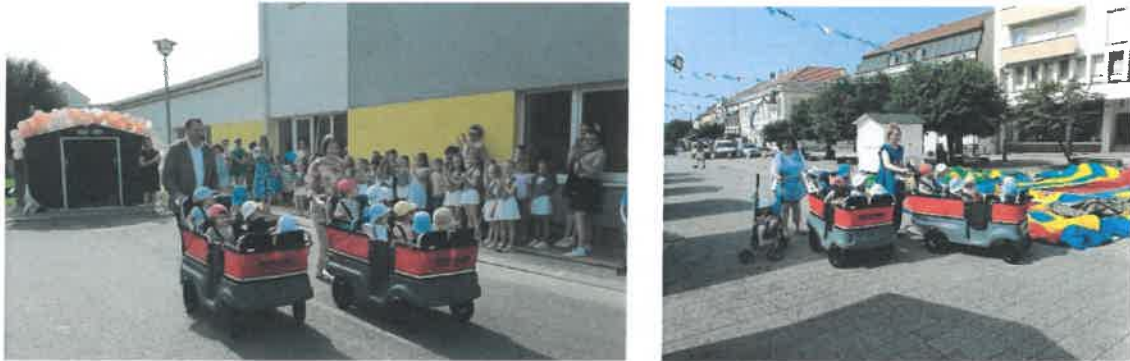
Slika 89. i 90. Prva vožnja autobus kolicima

Ove godine istaknuli bismo posebnu suradnju s Gradskom upravom koja nam je pripomogla pronaći donatore za autobus kolica namijenjena našim najmlađim vrtićancima. 21. lipnja 2023. su uz prisustvo gostiju i uzvanika uz kraći program autobus kolica puštena u uporabu. Također, daruvarske tvrtke su svojim donacijama omogućile financiranje vrtićkog kalendara, u kojemu se nalaze crteži svih naših odgojnih skupina.