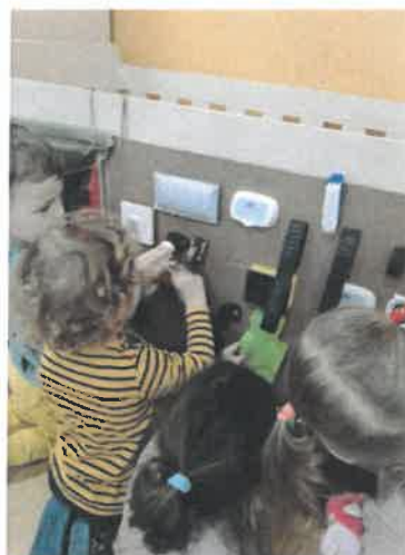
Slika 31. Projekt „Senzomotorika djece jasličke dobi“, Balončići

Odgojna skupina „Pandice“ provela je projekt na temu „Igre za poticanje senzomotoričkog razvoja“ kojemu je cilj bio potaknuti spoznajni razvoj i ostvarivanje senzomotoričke aktivnosti djece kroz prirodan oblik učenja čineći, istraživanjem.