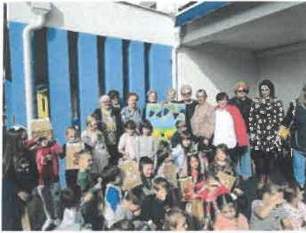
Slika 18. Umirovljenice iz Matice umirovljenika Daruvar