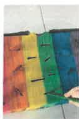
Slika 32. Projekt „Igre za poticanje senzomotoričkog razvoja“, Pandice