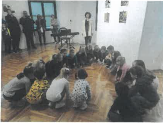
Slika 54. Nastup vrtičanaca povodom izložbe „Dječja mašta može svašta“