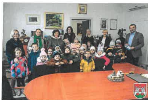
Slika 26. Posjet Suncokreta Centru R. Steiner