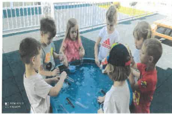
Slika 87. i 88. Djeca u ljetnim aktivnostima