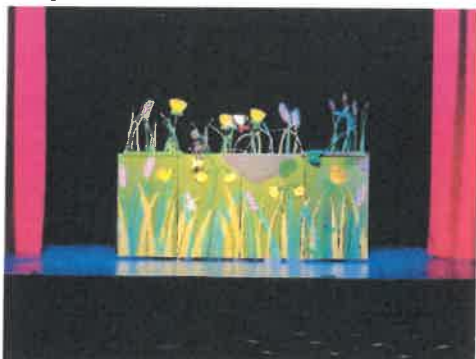
Slika 46. „Mudra glava maloga mrava“

U ožujku su naši predškolci slikali na glazbu Brune Bjelinskog u sklopu proslave 20. rođendana Glazbene škole, bili su na predstavi „Mudra glava maloga mrava“ u izvedbi produkcije Z u Kinu „30. svibnja“ Daruvar, a naše predškolske skupine Pčelice i Suncokreti sudjelovale su u Programu "Vidi i klikni" s HAK-om. Ideja programa je učenje kroz činjenje, a cilj je djecu u dobi od 6 -7 godina naučiti prepoznati i vidjeti opasnost u prometu, te ih učiniti vidljivima za vozače.