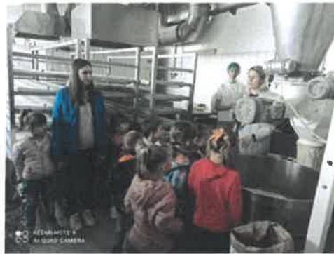
Slika 20. Posjet Pekarnici IMAKO

20. listopada 2022. predškolci iz odgojnih skupina Suncokreti i Pčelice posjetili su Pekarnicu IMAKO te Pučku knjižnicu i čitaonicu Daruvar, a Suncokreti su posjetili i Erste&Steiermärkische Bank.