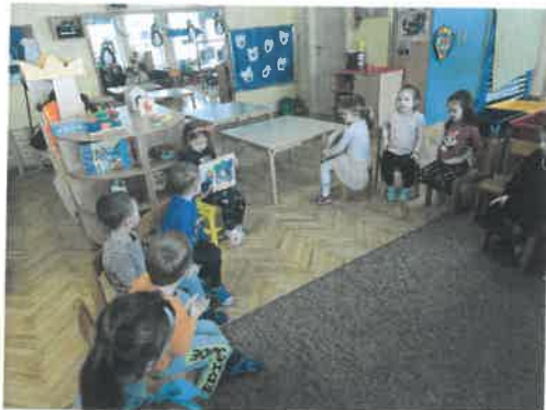
Slika 34. Projekt „Slikovnica i ja“, Oblačići

Odgojna skupina „Bubamare“ provodila je projekt „Šumske životinje“ kojim se poticao razvoj ekološkog senzibiliteta prema prirodi odnosno šumskoj zajednici, spoznaja o međusobnoj povezanosti životinja, biljaka i čovjeka te upoznavanje naših najčešćih šumskih životinja.