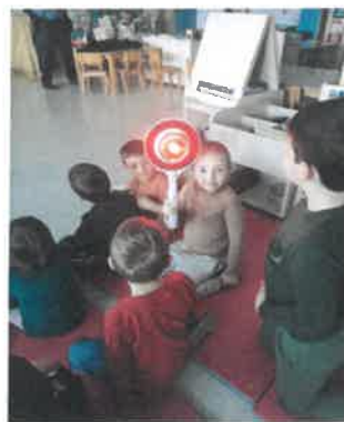
Slika 40. i 41. Projekt „Promet i dijete“, Tratinčice

U odgojnoj skupini „Suncokreti“ provodio se projekt „Raznolikost živog svijeta“. Osnovni ciljevi projekta bili su poticati djecu na uočavanje različitosti u svijetu oko nas, na uočavanje uzročno-posljedičnih odnosa te poticati znatiželju za upoznavanjem različitih biljaka i životinja. Većina djece u parku prepoznaje gdje raste određeno drveće, imenuju voće i povrće, šumske i domaće životinje te životinje dalekih krajeva i spoznali su da su nam različita zanimanja važna da funkcioniramo kao zajednica, što su osobito vidjela kroz organizirane posjete.