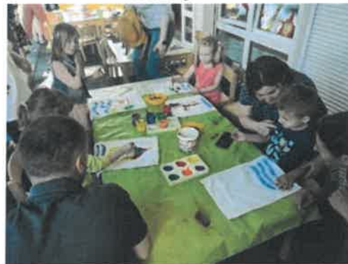
Slika 83. završna druženja, Cicibani