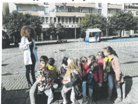
Slika 14. i 15. Posjet volontera iz Udruge Impress skupini Suncokreti

U listopadu u sklopu dječjeg tjedna naši su vrtićanci imali priliku uživati u edukativnom mjuziklu „Pingvin u Hrvatskoj“ s izvođačima iz studija „Suncokret“ osnivača Duška Mucala iz Splita.