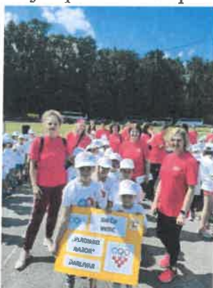
Slika 68. i 69. Olimpijada dječjih vrtića BBŽ