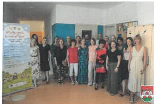
Slika 9. i 10. Završna konferencija Projekta „Vrtić koji gradi budućnost djece“