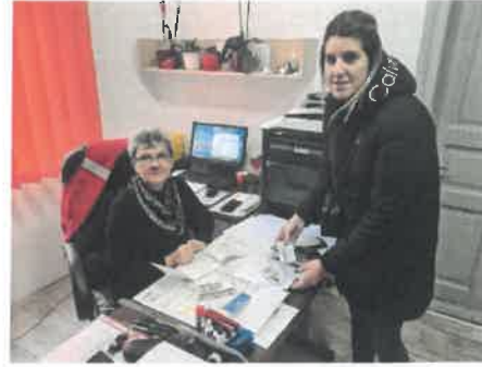
Slika 19. Solidarnost na djelu

U listopadu se provela akcija prikupljanja plastičnih čepova za djecu Udruge oboljelih od leukemije i limfoma u sklopu projekta "Plastičnim čepovima do skupih lijekova", u organizaciji Lige protiv raka Daruvar u udruge "Korak dalje" Daruvar.