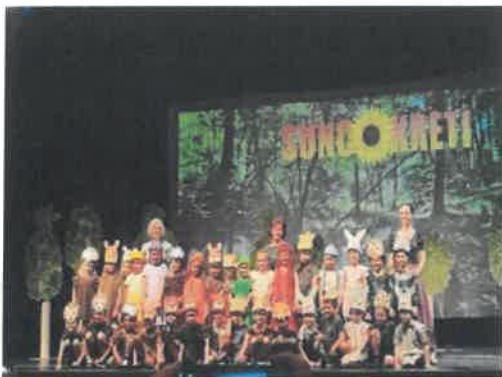
Slika 78. završna druženja, Suncokreti