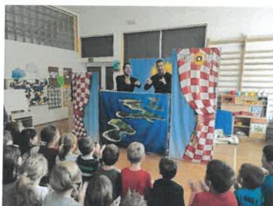
Slika 16. i 17. Predstava „Pingvin u Hrvatskoj“ izvođača iz studija Suncokret

U listopadu su djeca iz skupine Pčelice uživala u društvu umirovljenica iz Matice umirovljenika Daruvar, kada su gošće zajedno s djecom izradile prigodnu "sliku" koja je ostala kao uspomena na lijepo druženje u Vrtiću. Ujedno je svako dijete dobilo prigodnu poklon vrećicu koje su napravile vrijedne ruke umirovljenica.