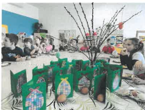
Slika 12. Tradicionalan Uskršnji doručak u vrtiću