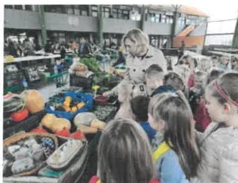
Slika 42. i 43. Projekt „Raznolikost živog svijeta“, Suncokreti