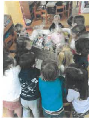
Slika 55. Sudjelovanje djece u humanitarnoj akciji

U odgojnim skupinama Bubamare, Pčelice i Suncokreti održane su radionice-igraonice "Fraktali svuda oko nas" u izvedbi profesora i učenika srednje škole" August Šenoa" iz Garešnice. U tjednu Crvenog križa djeca skupine Tratinčice posjetila su prostorije Crvenog križa Daruvar te su se upoznali s ulogom Crvenog križa u lokalnoj zajednici i sa svime što Crveni križ radi.