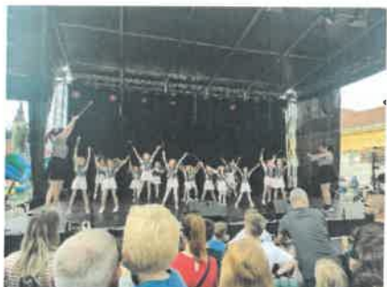
Slika 67. Nastup malih mažoretkinja na Vinodaru

Naše male mažoretkinje su s odgojiteljicama Sunčicom i Lucijom otvorile program Vinodara 2023., a naši predškolci sudjelovali su na 19. Olimpijadi dječjih vrtića naše županije. Osvojeno je dvanaest medalja i pehar za ukupno sudjelovanje za djevojčice.