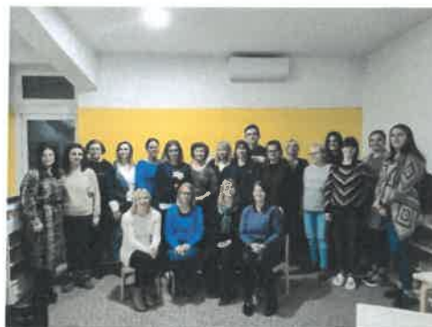
Slika 73. Edukacija „Kako djecu iz spektra autizma uključiti u vršnjačke aktivnosti“