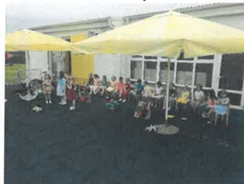
Slika 81. završna druženja, Bubamare