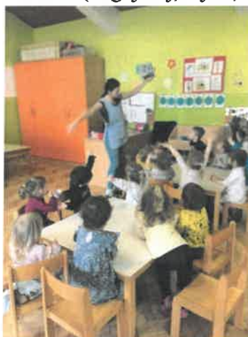
Slika 33. Projekt „Razvoj govora djece u trećoj godini života“, Ježići