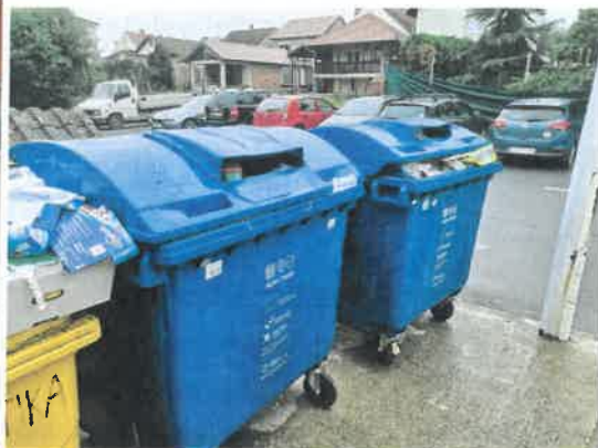
Slika 60. Sakupljanje i razvrstavanje otpada