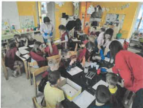
Slika 56. Igraonica „Fraktali svuda oko nas“

U odgojnim skupinama Bubamare, Pčelice i Suncokreti održane su radionice-igraonice "Fraktali svuda oko nas" u izvedbi profesora i učenika srednje škole" August Šenoa" iz Garešnice. U tjednu Crvenog križa djeca skupine Tratinčice posjetila su prostorije Crvenog križa Daruvar te su se upoznali s ulogom Crvenog križa u lokalnoj zajednici i sa svime što Crveni križ radi.