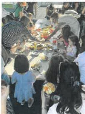
Slika 82. završna druženja, Točkice