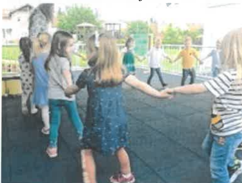
Slika 80. završna druženja, Oblačići