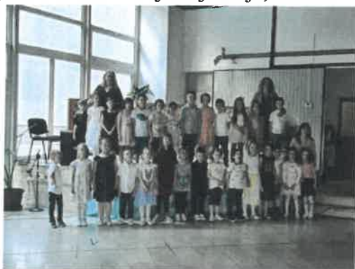
Slika 76. završna druženja, Pčelice

Na kraju svake pedagoške godine u svim odgojnim skupinama odgojiteljice osmišljavaju završno druženje s djecom i njihovim roditeljima. Završno druženje odvijalo se u Kinu 30. svibnja Daruvar, u Društveno-kulturnom centru Daruvar i u našem vrtićkom okruženju na zraku uz pomno organizirane i pripremljene uvjete kako bi završna svečanost na kraju godine ostavila trajno sjećanje, osobito za djecu koja napuštaju vrtić i kreću u školu.