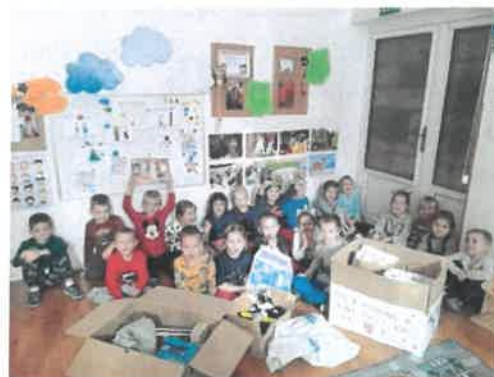
Slika 21. i 22. Odgojna skupina Bubamare s potrepštinama za napuštene pse

6. je prosinca Sveti Nikola s anđelom i krampusom podijelio djeci prigodne darove koje mu je osigurao Grad Daruvar, a daruvarski su nas pčelari obradovali poklonom od pet teglica meda.