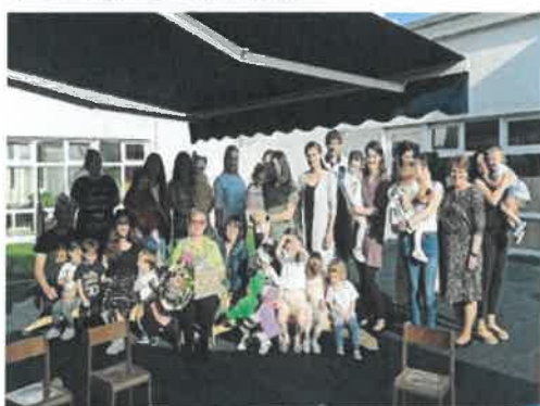
Slika 84. završna druženja, Ježići