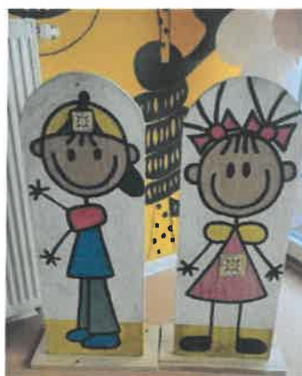
Slika 63. i 64. Proslava 71. rođendana vrtića

Skupina Tratinčice je sa svojim odgojiteljicama i asistenticom posjetila udrugu "Korak dalje". Nama koji se bavimo odgojem poznato je koliko veliki utjecaj imaju prijateljstvo i prihvaćenost za cjelokupni psihosocijalni razvoj svakog djeteta.