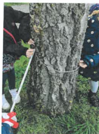
Slika 36. i 37. Projekt „Matematičke igre u predškoli“, Pčelice

Odgojna skupina „Cicibani“ provodili su projekt „Glazba u vrtiću“. Odabrana tema projekta potaknuta je dječjim interesom. Cilj i zadaća pojačanog programa glazbe u vrtiću bila je utjecati na razvoj komunikacijskih vještina, vizualne i slušne percepcije, pamćenja, mišljenja, opažanja, djelovanja, kritičkog mišljenja, motoričkih vještina, kreativnosti i mašte, vještine čitanja i emocionalne inteligencije.