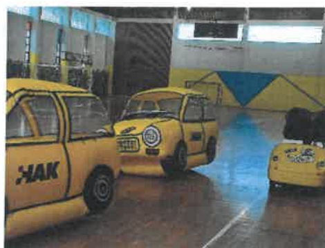
Slika 47. HAK „Vidi i klikni“

U ožujku su zaposlenici Vrtića počeli vježbati s trenericom Elenom Zinaić iz Studija MBS koji vodi Matea Ivanović. Vrtić je dao prostor, a polaznici su treninge plaćali.