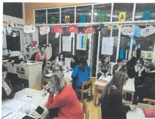
Slika 70. i 71. Edukacija „Uvodni Korak po korak u radu s djecom predškolske dobi“

12.11.2023. predavači iz Centra za kulturu prehrane iz Zagreba održali su našim kuharicama edukaciju s ciljem osvježavanja kuhinje, pripreme zdrave i raznovrsne prehrane za djecu. Edukacija je planirana i financirana iz Projekta.