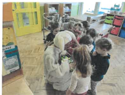
Slika 13. Posjet Uskršnjeg zeca odgojnim skupinama