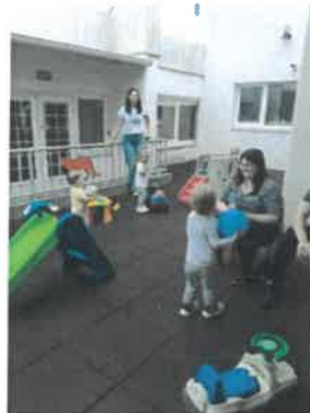
Slika 79. završna druženja, Balončići