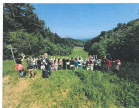
Slika 61. i 62. Aktivnosti na Petrovom Vrh

Ove je godine Vrtić slavio 71. godinu svoga postojanja koji je obilježen unutar ustanove.