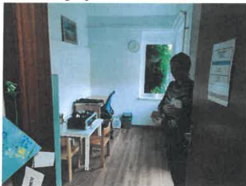
Slika 11. Logopetkinja Iva Jareš u novom uredu