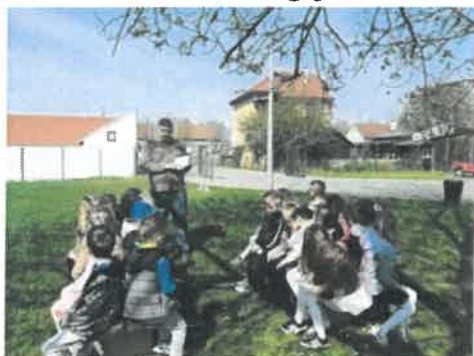
Slika 52. Sadnja oraha

U travnju povodom Europskog dana međugeneracijske solidarnosti predškolske skupine „Pčelice“ i „Suncokreti“ sudjelovale su u njegovu obilježavanju. Domaćin je bio Centar Rudolf Steiner u suradnji s Maticom umirovljenika Daruvar. Predškolci su sudjelovali u poligonu i dobili slatki zalogajčić.