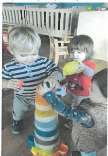
Slika 30. Projekt „Rupe – Šupljine“, Sovice

Odgojna skupina Balončići imala je temu projekta „Senzomotorika djece jasličke dobi“ kojima su stvorili poticajno okruženje i omogućili djetetu stimulaciju osjetila za ravnotežu, dodir, vid, sluh, miris i okus.