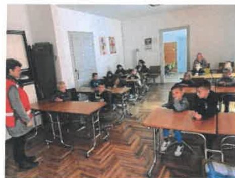
Slika 57. Tratinčice u posjetu Crvenom križu

Krajem svibnja u izvedbi odgojiteljica lutkarske skupine našeg vrtića odigrala se lutkarska predstava "Nezgode Mede Medića". Kroz predstavu smo se podsjetili na četiri čarobne riječi: molim, hvala, izvoli, oprost!