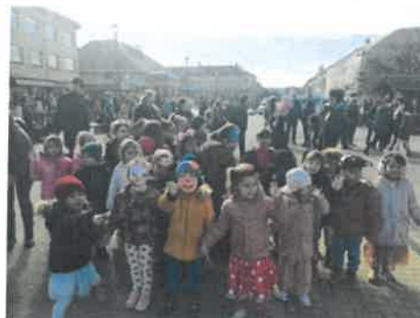
Slika 44. i 45. Vrtićanci u maškarama

U ožujku su naši predškolci slikali na glazbu Brune Bjelinskog u sklopu proslave 20. rođendana Glazbene škole, bili su na predstavi „Mudra glava maloga mrava“ u izvedbi produkcije Z u Kinu „30. svibnja“ Daruvar, a naše predškolske skupine Pčelice i Suncokreti sudjelovale su u Programu "Vidi i klikni" s HAK-om. Ideja programa je učenje kroz činjenje, a cilj je djecu u dobi od 6 -7 godina naučiti prepoznati i vidjeti opasnost u prometu, te ih učiniti vidljivima za vozače.