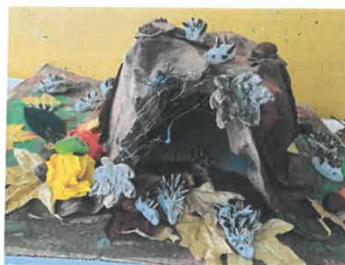
Slika 35. Projekt „Šumske životinje“, Bubamare

Odgojna skupina „Pčelice“ provodila je projekt „Matematičke igre u predškoli“. Cilj je bio potaknuti spoznajni razvoj djece kroz matematičke igre, usvajanje osnovnih matematičkih pojmova te na pronalaženje različitih načina i pristupa rješavanja matematičkih problema.