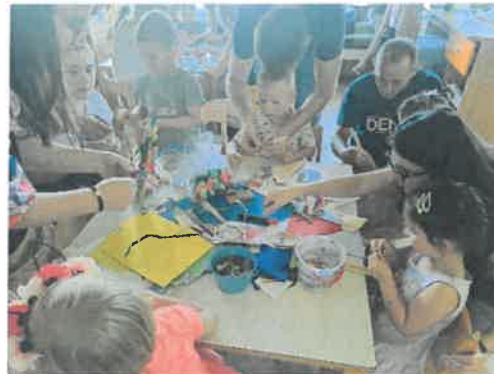
Slika 85. završna druženja, Zvezdice