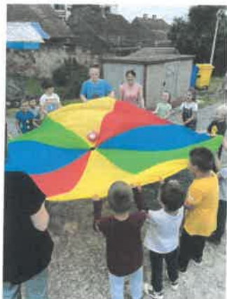
Slika 65. Posjet Udruzi „Korak dalje“