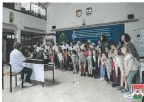
Slika 53. Druženje umirovljenika i djece

U svibnju je u Zavičajnom muzeju Daruvar otvorena izložba digitalnih radova "Dječja mašta može svašta" idejnog autora Saše Selihara. Riječ je o prvoj izložbi crteža u Hrvatskoj koje je generirala umjetna inteligencija uz upute koje su joj dala djeca. Izložba je otvorena nastupom predškolskih skupina "Dječjeg vrtića" Vladimir Nazor" Daruvar i Češkog dječjeg vrtića Ferde Mravenca Daruvar.