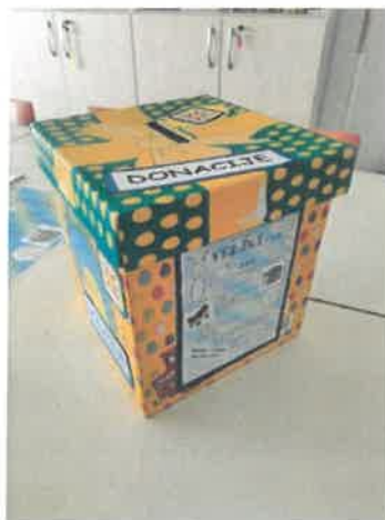
Slika 50. i 51. Donatorska predstava „Veliki mali zec“