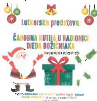
Slika 28. Plakat za lutkarsku predstavu

20. prosinca naše su odgojiteljice iz lutkarske skupine održale predstavu za djecu našeg vrtića – Čarobna kutija u radionici Djeda Mraza, a u siječnju 2023., povodom dana smijeha, u vrtiću je održana predstava Jozo Bozo „Stepenicama do zvijezda“. Sva djeca dobila su magnete na poklon.