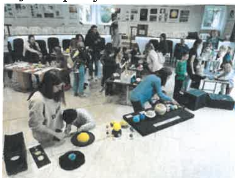
Slika 48. i 49.. Astroigraonica u Društveno-kulturnom centru Daruvar