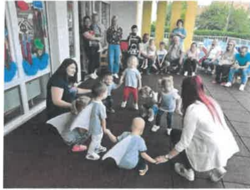
Slika 86. završna druženja, Pandice

I ove pedagoške godine posebno je planiran rad u vrijeme ljetnih praznika, na temelju provedene ankete za roditelje u mjesecu lipnju. Na temelju anketa napravljen je i plan korištenja godišnjih odmora djelatnika Vrtića. Planirano je najprije 10 odgojnih skupina, a kasnije je broj djece opadao tako da je u jednom trenutku u radu bilo aktivno 7 odgojnih skupina. Radili smo s djecom u mješovitim skupinama sve do kraja mjeseca kolovoza, kada su krenule pripreme za novu pedagošku godinu.